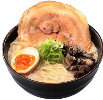
「さつま知覧どりの炭火焼き濃厚鶏白湯」