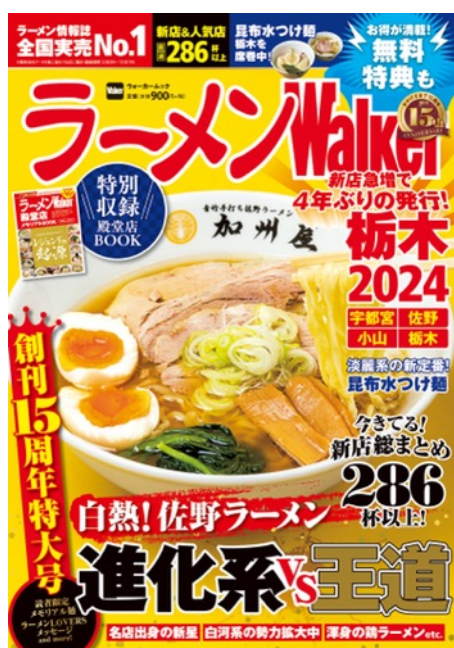
『ラーメン Walker 栃木 2024』

株式会社角川アスキー総合研究所（本社：東京都文京区、代表取締役社長：加瀬典子）は、『ラーメン Walker2024』の第3弾として、栃木版（2023年10月11日発売）、山形版（2023年10月18日発売）、神奈川県版（2023年10月24日発売）を順次刊行します。